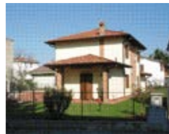
Progetto e Costruzione di villa unifamiliare in quartiere Boschetto Cremona