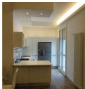
Particolare interno di una ristrutturazione

ESEGUIAMO DIRETTAMENTE RIMOZIONE DI CEMENTO AMIANTO ALBO NAZ. IMP. GESTIONE RIFIUTI CAT.10/A CLASSE E