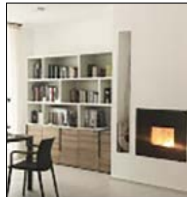
Copertura camini e complementi di arredo