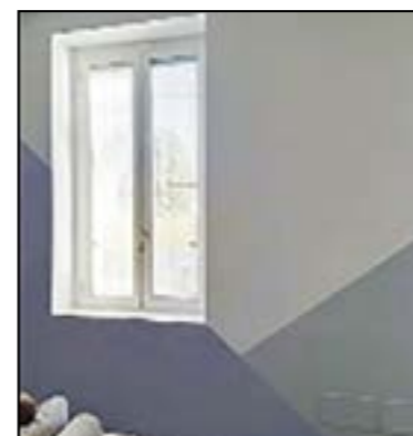
Pittura di interni