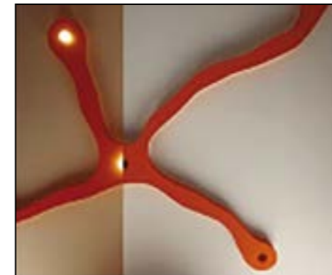
Controsoffitti di qualsiasi tipologia