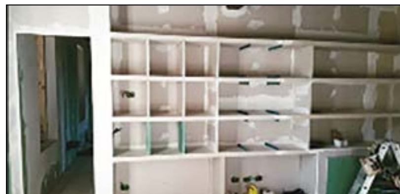
Controparete e parete arredata con inserimento porta rasomuro