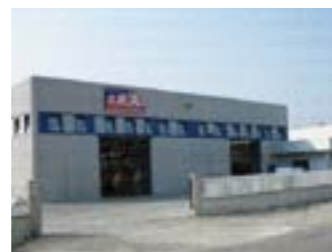
Progetto e Costruzione Officina meccanica in Cremona