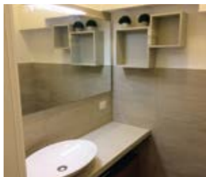
Particolare interno di una ristrutturazione