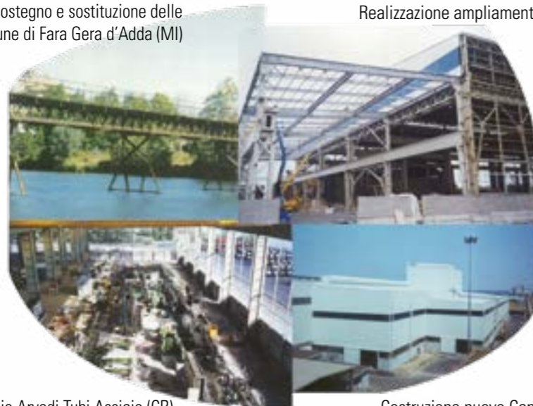
Montaggio linea S6 Tubificio Arvedi Tubi Acciaio (CR)